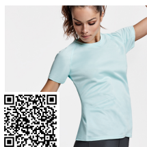
BAHRAIN WOMAN CA0408