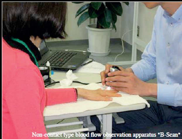
Non-contact type blood flow observation apparatus "B-Scan"